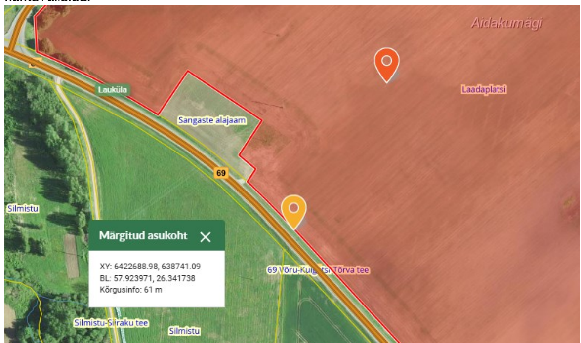
Joonis nr 1. Ristumiskoha asukoht on tähistatud oranži tingmärgiga..